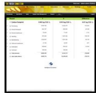
CO2負荷状況 (企業のカーボン フットプリント)