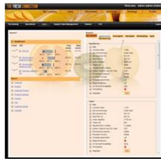
営業担当者画面 (営業担当者の業績 及び意思決定項目)