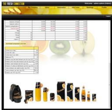
製品情報 (賞味期限、製品、コンテナ、 内容物、CO2排出量)