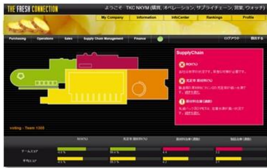
会社情報 (役割別のKPIと主なアラート)