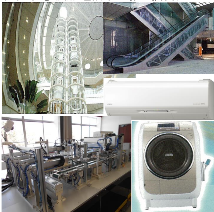
シーケンス制御を適用した製品例

研修窓口: 日立アカデミー ソリューション推進部 (hiac.bp-ml.xz@hitachi.com) (03-5471-8958)