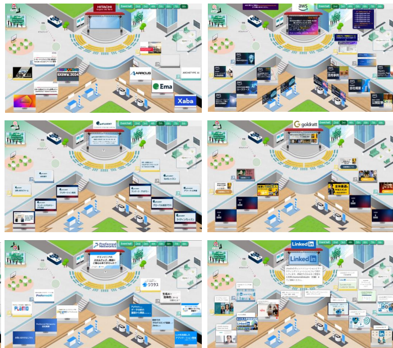
出展企業展示会場: 2nd~8th