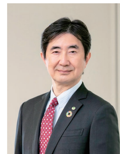
株式会社 日立アカデミー 取締役社長

動する力、そして変化の激しい社会においてもつねに学び続ける力が、ますます重要なものとなるでしょう。当社では、我々の強みであるIT・OT*、DX・GX、経営・ビジネス・リーダーシップの分野を中核にした、多彩な人財育成プログラムを展開しています。また、世界中から多様な人々が集い、自律的に学び合い、刺激し合い成長する“知の拠点”となることをめざしてまいります。日立グループの目標は、データとテクノロジーでサステナブルな社会を実現し、人々の幸せを支えること。その一環として、人と企業の成長を支える日立アカデミーにどうぞご期待ください。